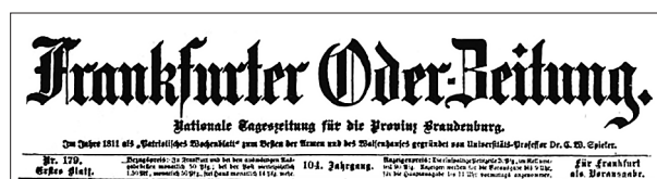
Fig. 2. Masthead of the main daily newspaper in the former Brandenburg-Neumark Province – “Oderzeitung”.

While it has been 75 years since the end of the war, archaeologists still struggle with reconstructing the lost